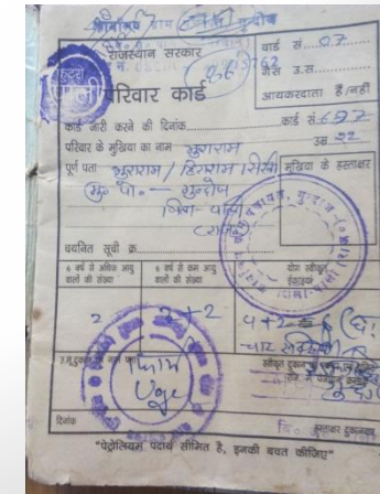
Ration card seal