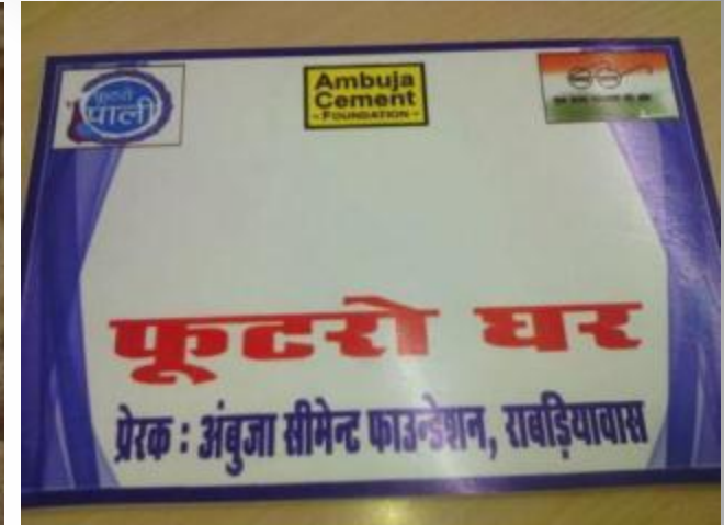
Name Plates for Households