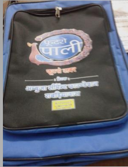
School Bag with campaign logo