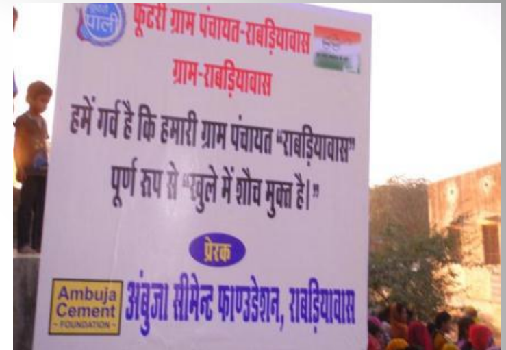
Panchyati Raj Minister Flagged the Gaurav Yatra at Rabriawas.